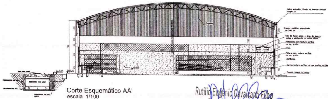
Corte Esquemático AA' escala 1/100

Rutilio Eugênio Cavalcanti Filho Prefeito Municipal